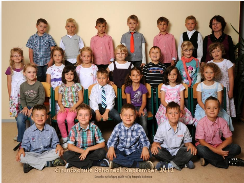
Grundschule Schöneck September 2012 Klassenfoto